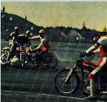
Финальная встреча команд РСФСР и Украины.

Мотоболный турнир принадлежал к тем немногим спартакиадным соревнованиям, где прогноз относительно двух первых призеров можно было сделать безошибочно — конечно же, сборные Российской Федерации и Украины. Вот только в каком порядке они финишируют? И все же предпочтение отдавалось команде РСФСР, хотя бы на том основании, что она еще ни разу не уступала главные спартакиадные награды.